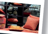
Abbildungen beispielhaft – keine finalen Layouts